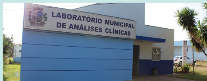
Reforma do Laboratório Municipal de Análises Clínicas: manutenção e reparos de banheiros, piso, pintura de fachada e aquisição de equipamentos.

Raios-X, reveladora digital, eletrocardiógrafos, oxímetros, monitores de sinais vitais, bisturi eletrônico, oxímetro de pulso neonatal, entre outros.