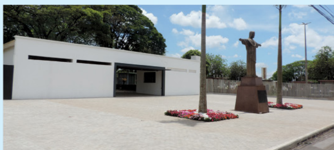
Reurbanização do Cemitério Municipal com acessibilidade, reforma integral dos banheiros, construção de fraldário, nova área administrativa, iluminação de LED, aquisição de terreno para ampliação.

Construção de anfiteatro, trilha para visitantes, trilha para ciclistas e recuperação da floresta para transformar o local em um Jardim Botânico com mais de 600 espécies.