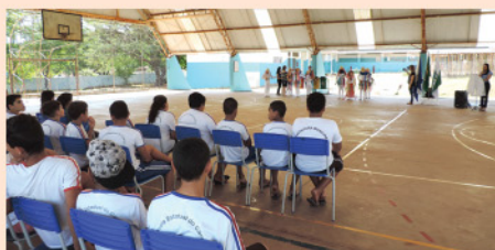
Aquisição de material pedagógico e instalação de tela de proteção na quadra esportiva da Escola Municipal do Campo Padre Ladislau Ban.