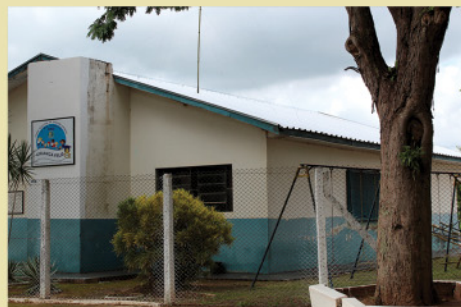
Substituição do telhado do CMEI Criança Feliz.