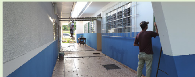
Conclusão da reforma dos banheiros, refeitório, cobertura e estrutura predial do CMEI Pe. Monsenhor B. Lauria.