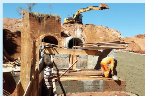
Recuperação completa de 5 emissários para receber o escoamento correto das águas pluviais captadas pelos bueiros do município.