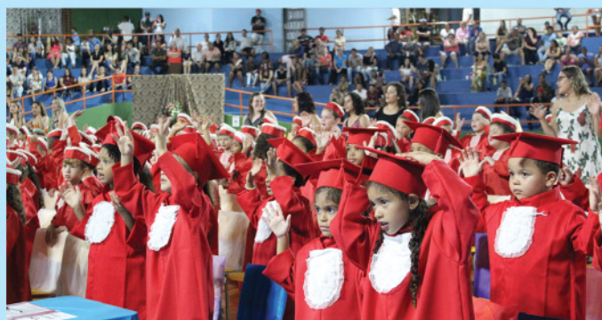
Realização de formatura coletiva para alunos dos CMEIS e 5º anos da rede municipal.