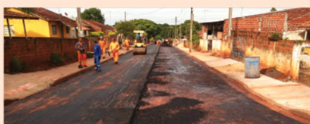
Recapeamento asfáltico de 6 mil m 2 de ruas e avenidas do distrito Barão de Lucena.