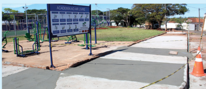
Execução de calçadas em repartições públicas: Escola Municipal Nice Braga, CMEI Casulo, Hospital Municipal, CREAS, Abrigo, Praças e outras.