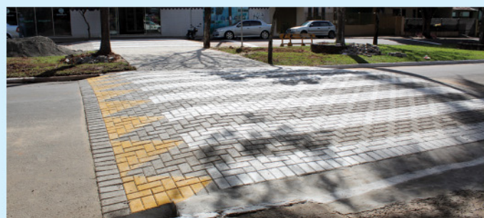
Ações de trânsito: construção de 8 travessias elevadas em pontos de fluxo de pedestres; instalação de semáforo na Av. São José; construção de lombadas; mobilizações educativas.