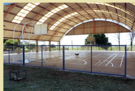
Instalação de telas de proteção na quadra esportiva, findando um problema com a entrada de pássaros e outros.