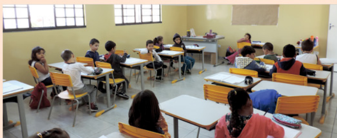
Manutenção da estrutura predial e construção de nova sala de aula no CMEI Lúcia Nonciboni.