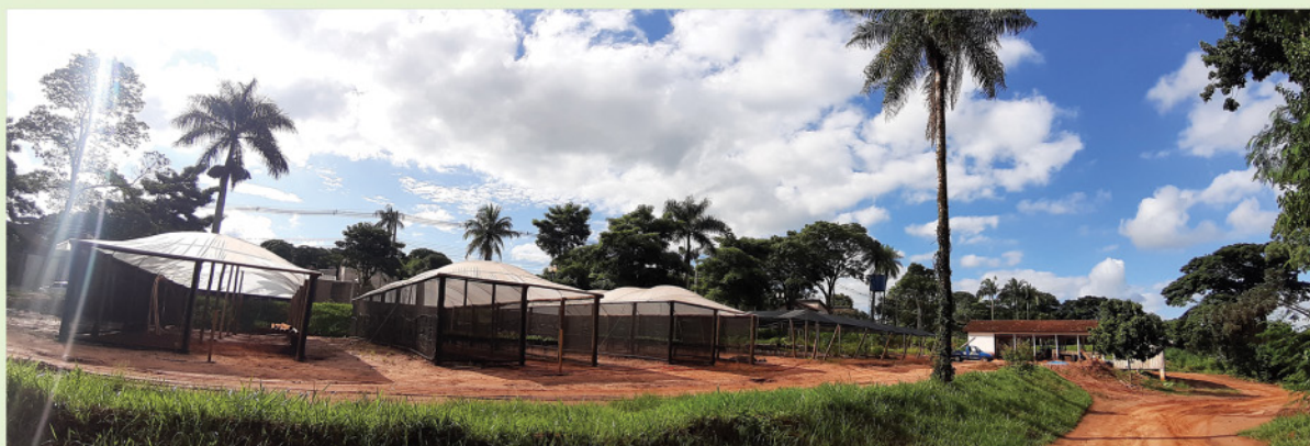
Revitalização do Viveiro Municipal com a construção de três novas estufas, início das obras de reforma dos banheiros e manutenção da estrutura.