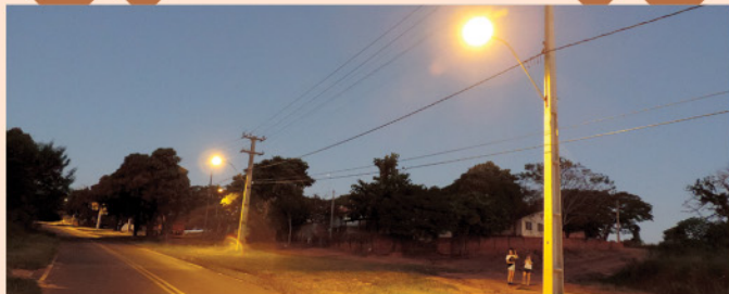
Ampliação da rede de iluminação pública e início da execução de pavimentação asfáltica no Conjunto José Herdeí.