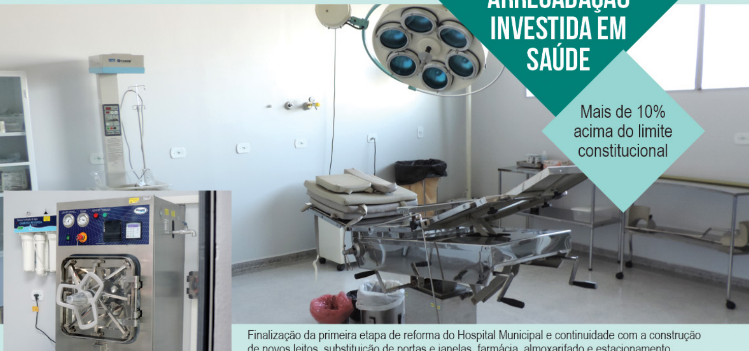
Finalização da primeira etapa de reforma do Hospital Municipal e continuidade com a construção de novos leitos, substituição de portas e janelas, farmácia, almoxarifado e estacionamento.

Mais de 10% acima do limite constitucional