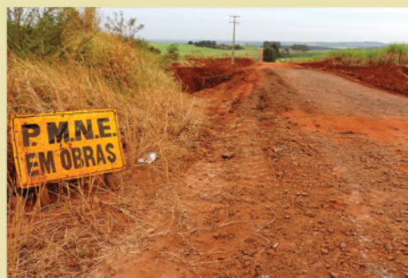
Recuperação, encascalhamento e manutenção de estradas rurais e pontes.