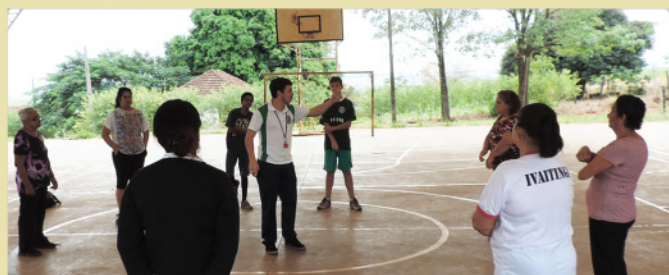
Projeto Distrito em Ação, uma parceria da Unidade Básica de Saúde e Secretaria de Esportes.