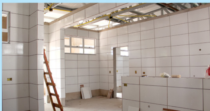
Continuidade na obra de construção da Creche Proinfância. Novas vagas a partir do segundo semestre de 2020.