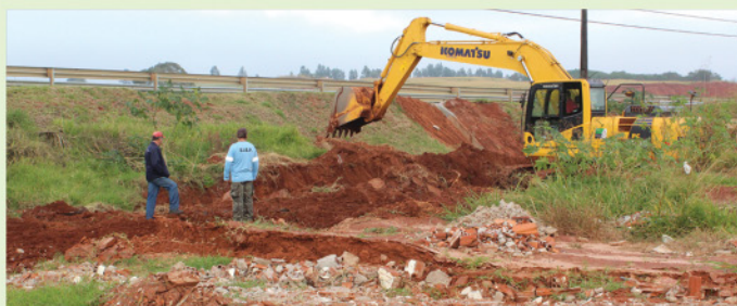
Construção do sistema de drenagem pluvial no Parque Cidade Alta. O processo antecede as instalações de galerias pluviais e posteriormente o asfaltamento do bairro.