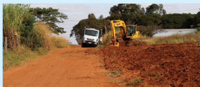
Recuperação de mais de 100 quilômetros de estradas rurais com encascalhamento de trechos críticos, levantamento do solo, caixas de contenção de água das chuvas.