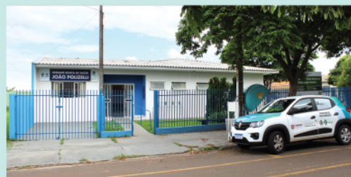
Reforma predial da UBS João Polizelli no Jardim Santo Antônio.

MAIS DIGNIDADE NO TRANSPORTE INTERMUNICIPAL DE PACIENTES