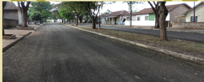
Recapeamento asfáltico e manutenção de canteiros públicos.