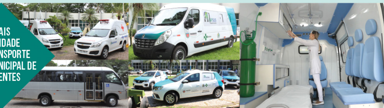
12 novos veículos: 4 ambulâncias, 2 ônibus para transporte intermunicipal de pacientes e 6 carros para as UBS's e/ou serviços administrativos.

MAIS DIGNIDADE NO TRANSPORTE INTERMUNICIPAL DE PACIENTES