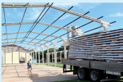
Andamento na construção e cobertura dos galpões para uso de práticas esportivas e Feira do Produtor.