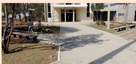
Recuperação do calçamento da Praça da Igreja Matriz e manutenção de canteiros.