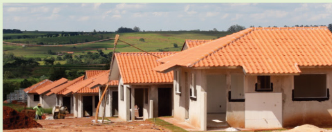
Conjunto Hab. Pioneiro Orestes Men: entrega de 133 novas residências em parceria com Governos Federal e Estadual.

Paisagismo e jardinagem dos canteiros públicos com espécies cultivadas no Viveiro Municipal.