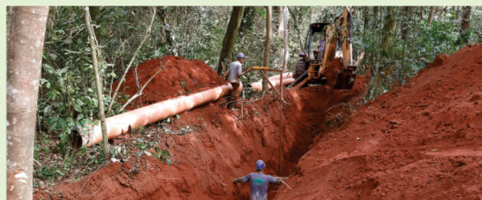
Em parceria com a Sanepar, o município ampliou em 70% sua capacidade de cobertura de esgotamento sanitário.